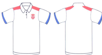
Слика бр. 5 Мајца са крагном –Поло мајца