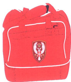
Слика бр. 9 Спортска торба